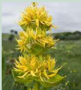
La gentiane jaune