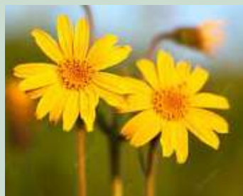
L'arnica des montagnes