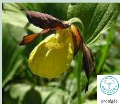
Sabot de vénus